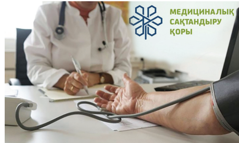
МЕДИЦИНАЛЫҚ САҚТАНДЫРУ ҚОРЫ

Мұның бірі де орындалмады. «Медсақтандырылған» адамдар- дың да емханадағы салалық дәрі- гердің қабылдауына кіре алмай, ақылы клиникаларда өз ақшасына емделетінін, оларға амбулатория- лық жағдайда тегін дәрі берілмей- тінін, яғни бұрынғыдан ештеңе өзгермегенін көрген өзге адамдар МӘМС жүйесіне кіруге асықпады.